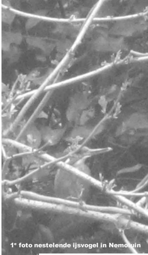
1° foto nestelende ijsvogel in Nemo tuin