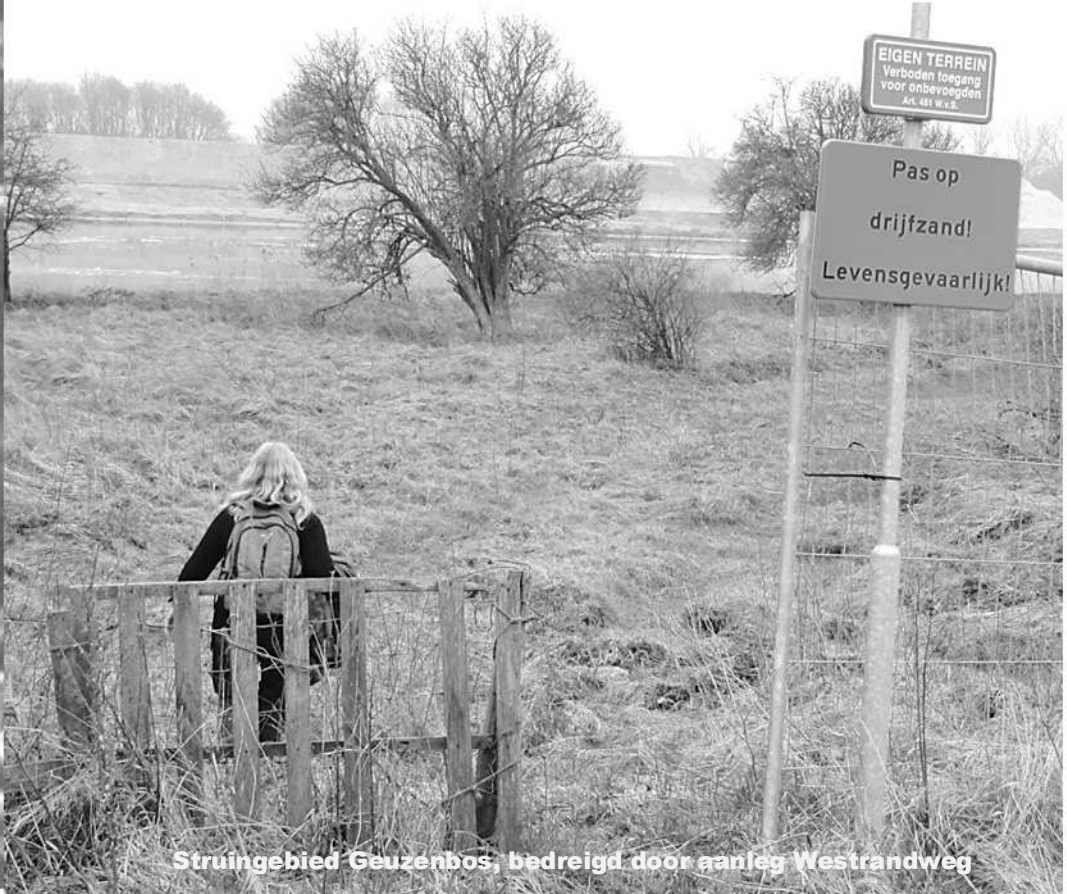
Struingebied Geuzenbos, bedreigd door aanleg Westrandweg