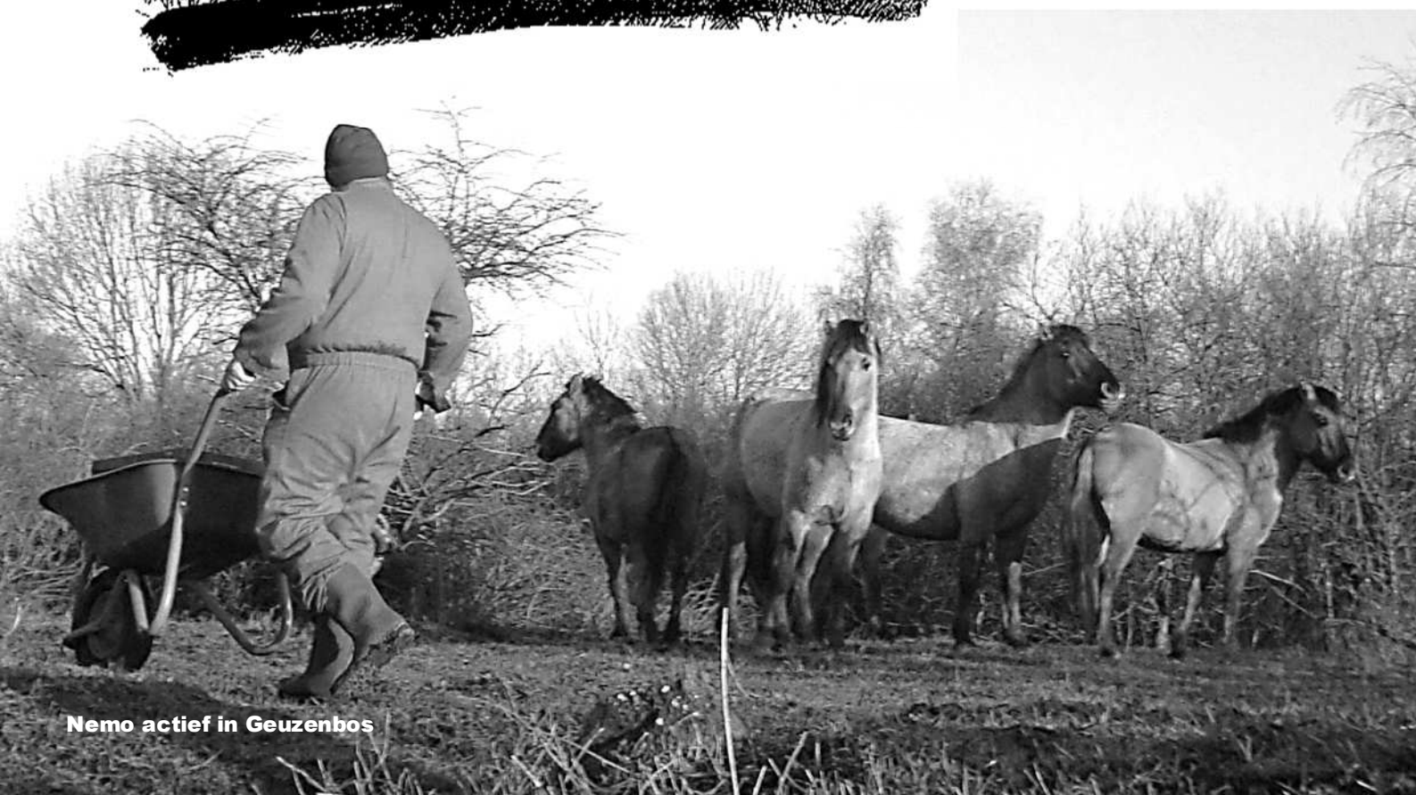
Nemo actief in Geuzenbos