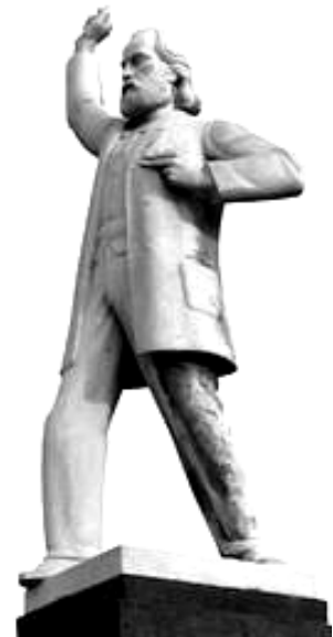
Beeld Domela Nieuwenhuis naast het Nemokantoor (Westerpark)

WANDELAARS EISEN HET RECHT OM TE STRUINEN!