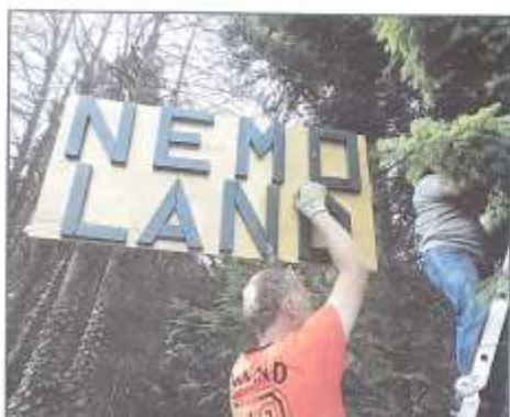
Het buurttuinhuus krijgt een nieuw uitzicht, april 2014