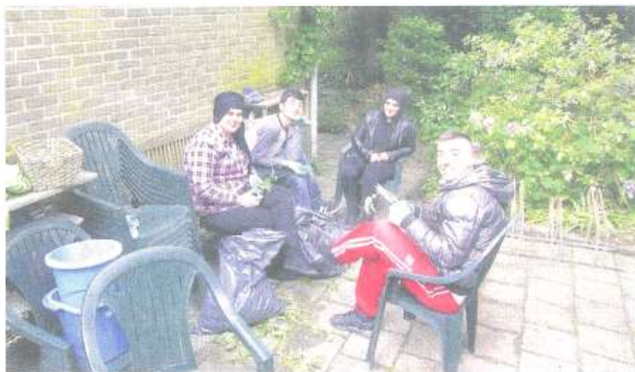
Scholieren van het Huygens College op natuurstage bij Nemo

Meer dan twee maanden geleden heeft Nemo haar bezwaren en voorstellen ingediend. De groene wandelaars zochten naar een modus om door te kunnen gaan na de snoeiharde bezuinigingen. Ze waren altijd financieel onafhankelijk, zonder structurele subsidie. In 2012 had Nemo een exploitatietekort van 14.000,-. In 2013 wordt dat tekort nog groter. Voor dit jaar heeft Nemo een groot aantal levensvatbare plannen voor de buurt op stapel staan die passen in het beleid van het stadsdeel. Met deze activiteiten zou Nemo de huurruimschoots terug kunnen verdienen voor het stadsdeel. Het zou reëel zijn om Nemo net als de kinderboerderij, het Woeste Westen en de schooltuinen als een buurt/groenvoorziening te beschouwen, waarvoor geen huur gerekend hoeft te worden. Eigen inkomsten genereren is geen optie. De ruimte is beperkt en bovendien mag Nemo volgens het huurcontract geen horeca bedrijven of de