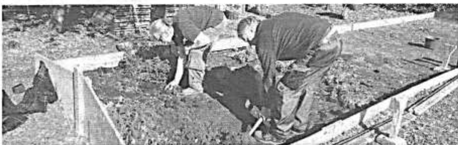
De nu nog verwilderde nieuwe buurtmoestuin van Nemo wordt ontgonnen.