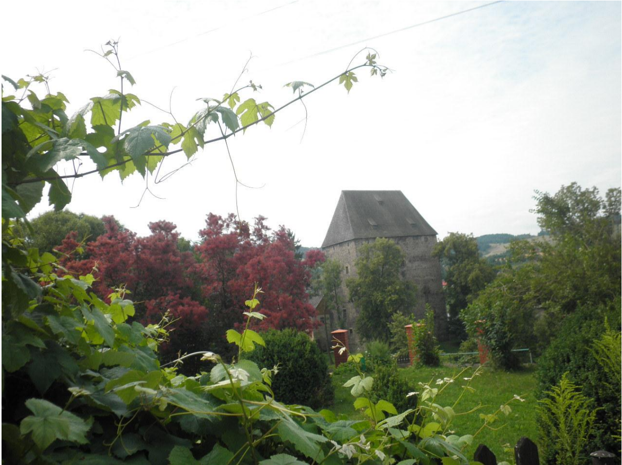
De Middeleeuwse woontoren, van binnen en van buiten.