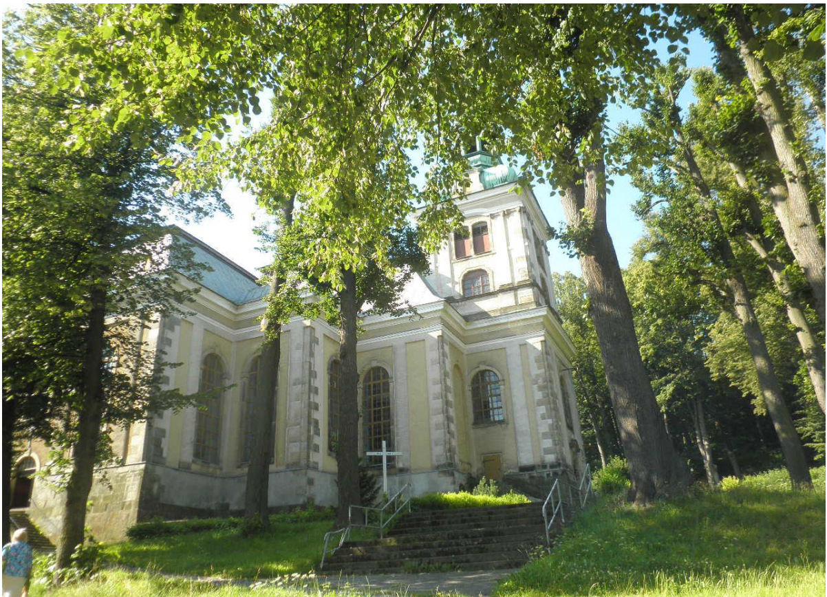
St. Maria Rosenkranz Kirche