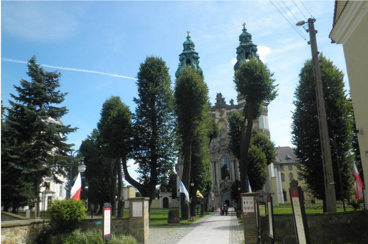
De kathedraal van Krzeszów.