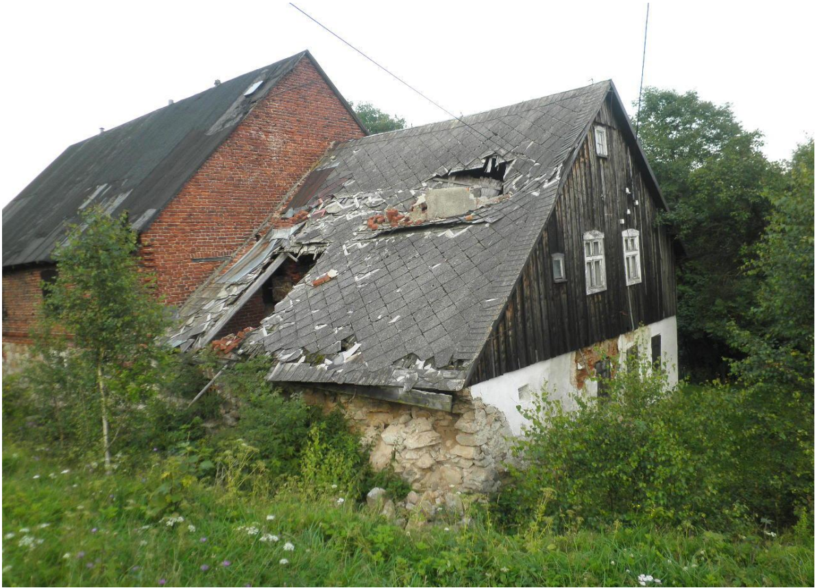
Verlaten boerenwoningen bij Czartak.