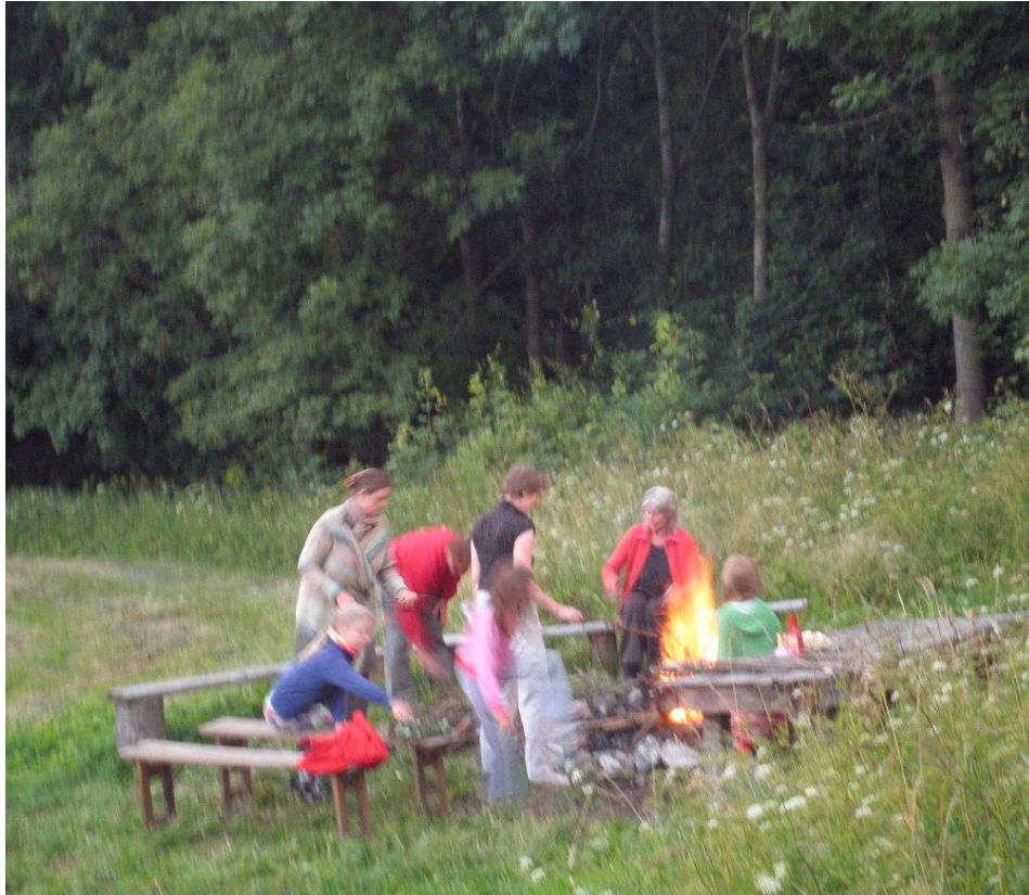
Worstjes roosteren op het vuur bij Czartak.