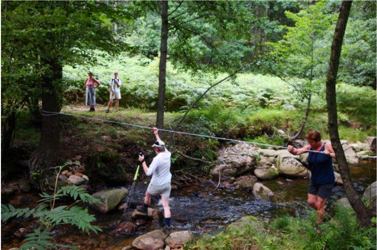
Oversteekplaats in het riviertje op het Nemo terrein.