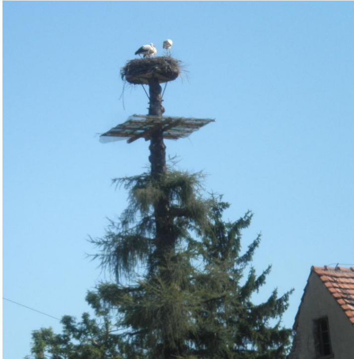
Ooievaarsnest in Kamienna Góra