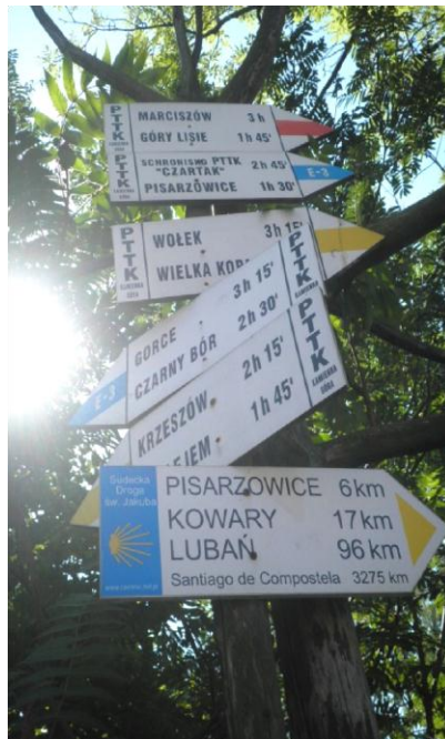
Santiago nog zoveel kilometers!