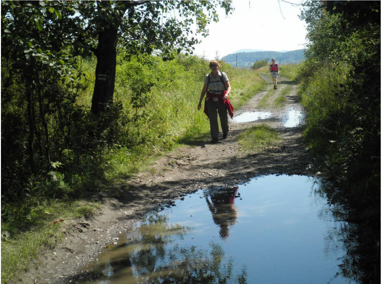
De weg is lang en de zon heet.