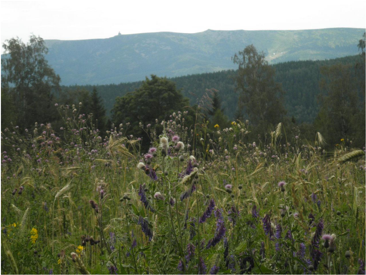
In de verte het weerstation in het Reuzengebergte.