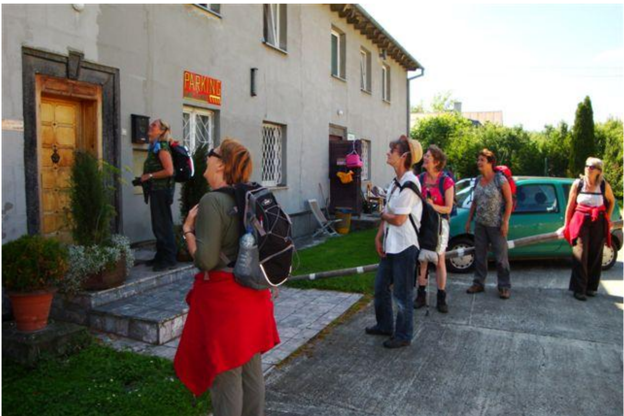
De pelgrims kloppen aan voor overnachting.