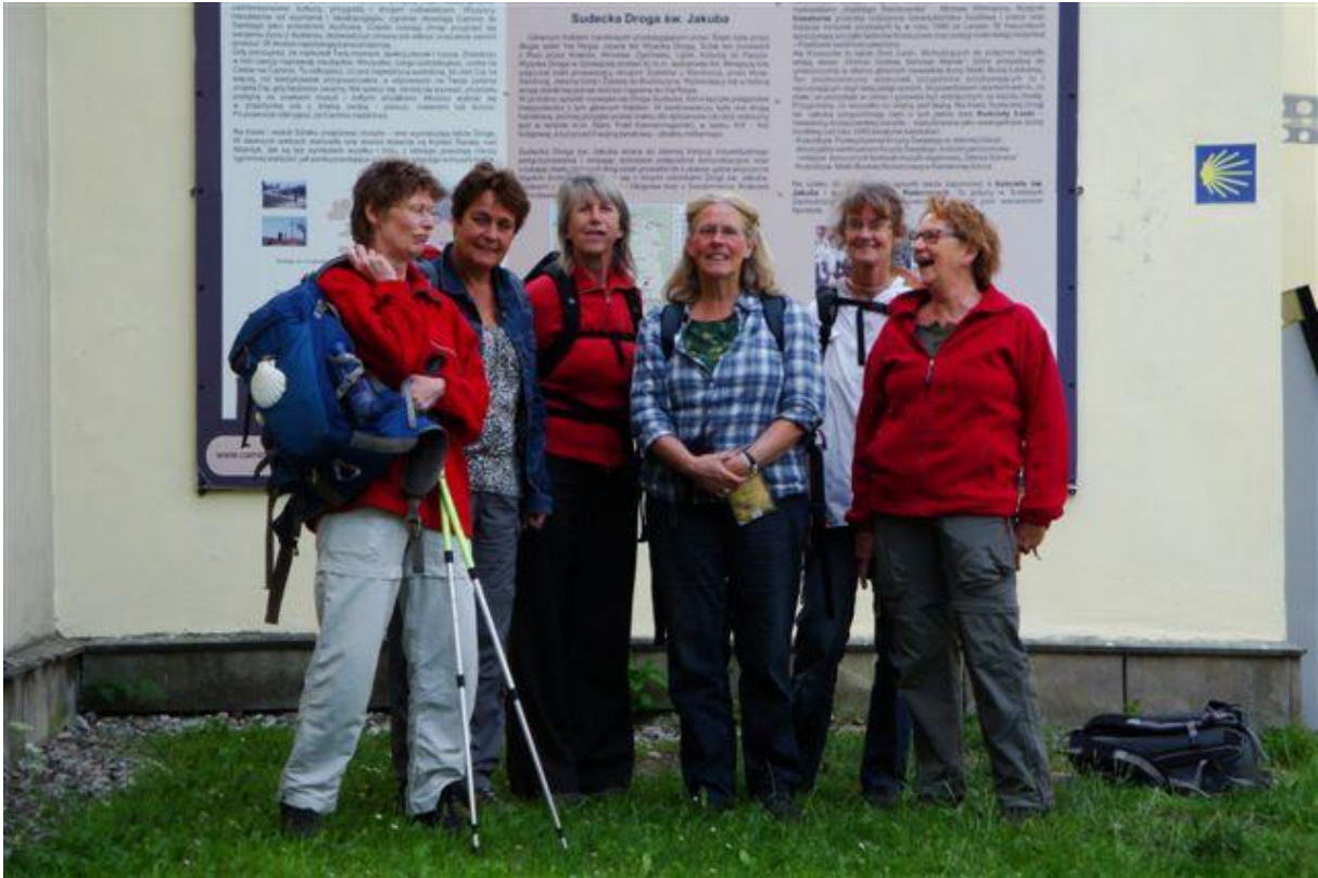
De stoere pelgrims, aan het begin van de tocht.