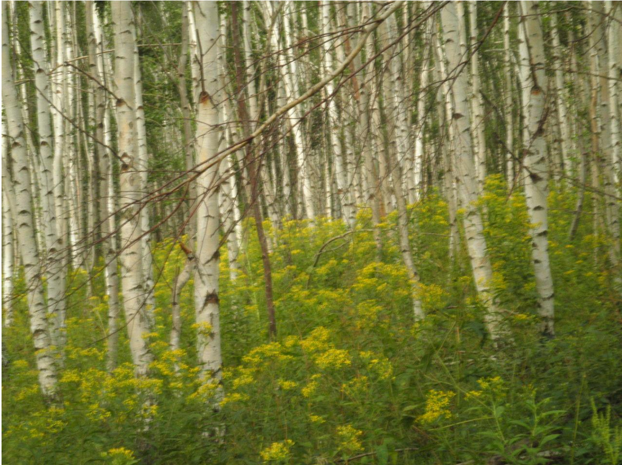
Berkjes met boerenwormkruid in de buurt van Nemo.