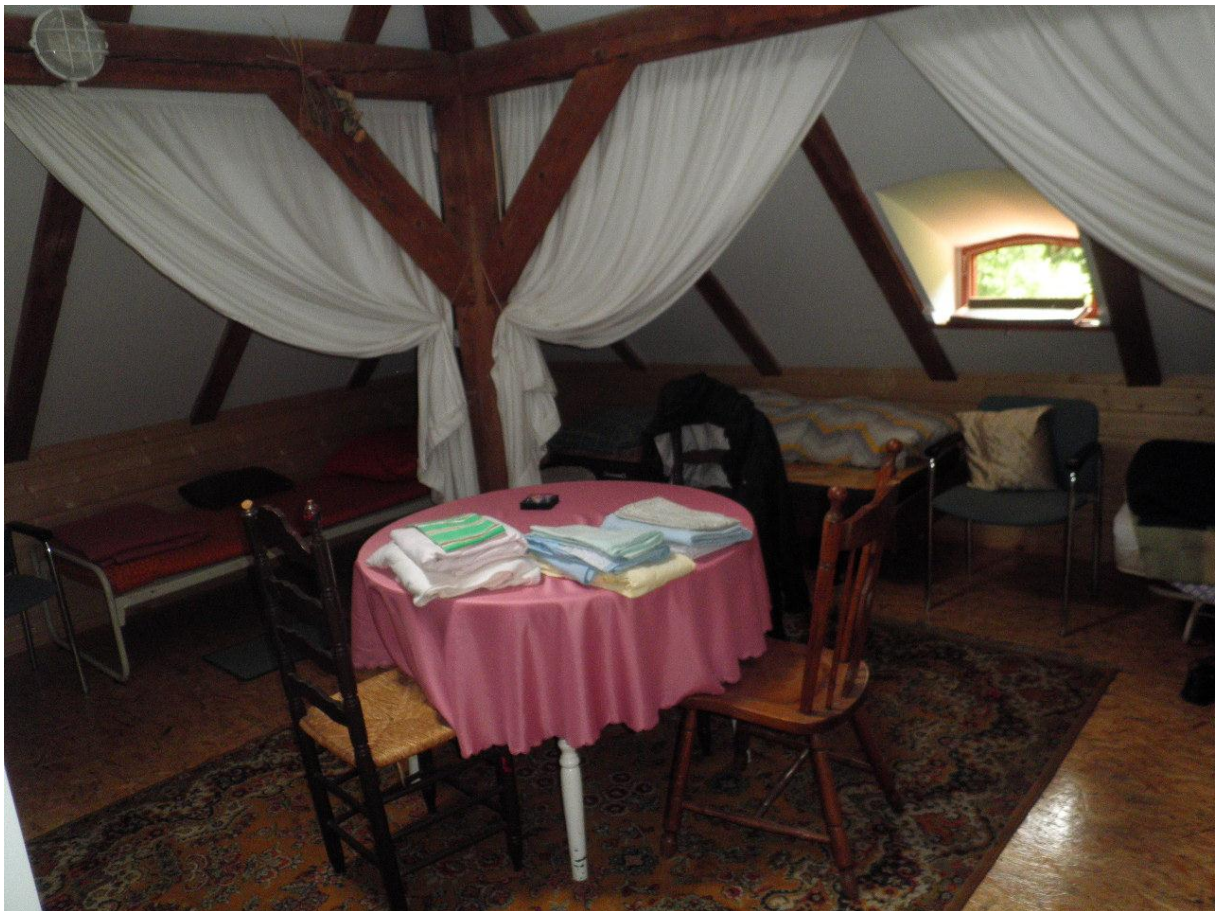
Slaapzolder bij Nemo. Lakens en handdoeken liggen klaar voor de gasten.