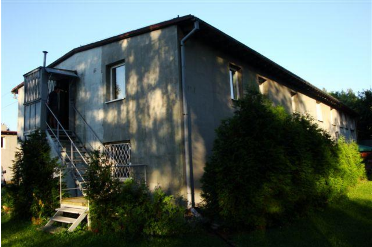
De barak waar wij slapen.