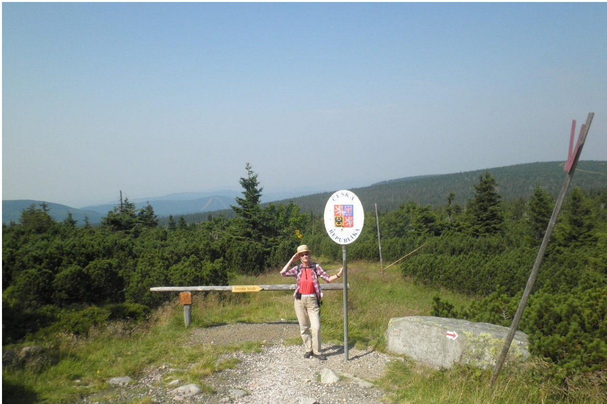
De grens met Tjechië loopt door het Reuzengebergte.